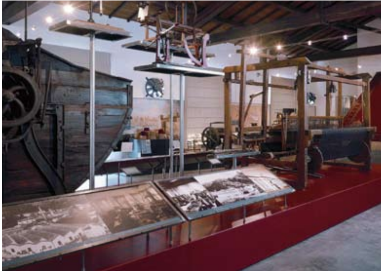
1. Museo del Tessuto di Prato

Prato guarda al futuro. Nello stesso periodo della mostra tutta la rete museale – dal Museo dell'Opera del Duomo e dalla Cattedrale di Santo Stefano con gli affreschi del Lippi fino alla Galleria di Palazzo degli Alberti e all'Archivio di Stato di Prato – sarà interessata da iniziative espositive collegate al tema del tessile o alla vocazione della città al contemporaneo, che ha nel Pecci il suo punto di riferimento. Con la Card_a_Prato si potranno avere sconti nei musei, nelle mostre, nei negozi, ma anche su taxi, parcheggi e altro ancora. Eventi, spettacoli, manifestazioni nel nome degli Zar si susseguiranno nelle vie delle città, nei negozi, nei teatri; un itinerario dello "shopping in fabbrica" condurrà negli spacci aziendali e tra i negozi d'artigianato artistico; e anche la grande tradizione gastronomica ed enologica del territorio strizzerà l'occhio alle trame culturali, affascinanti e ricche di inediti intrecci d'arte, che questa mostra ha saputo tessere.