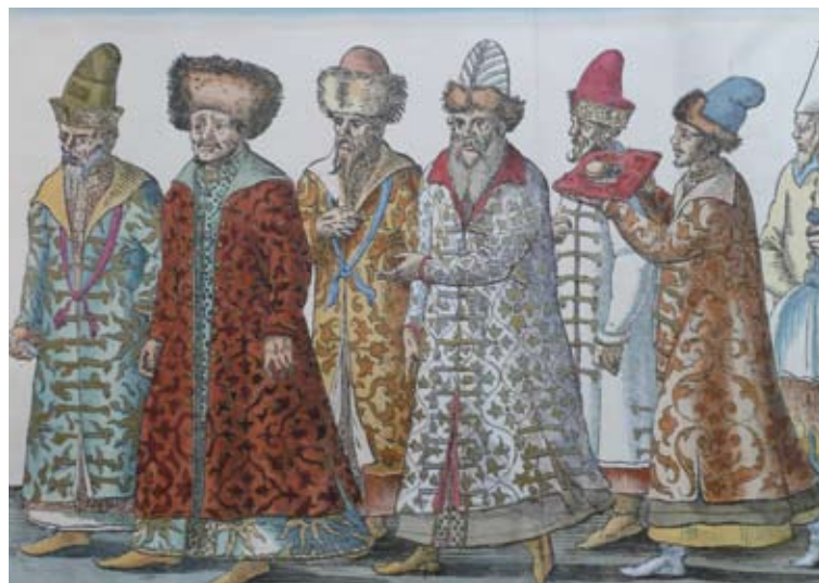
12. Ritratti dei sovrani di Mosca, il Granduca Ivan III, Vasily Ivanovich, Ivan IV Grozny e i loro ambasciatori (particolare). Stampa squerrelata dell'Ottocento da originale del Cinquecento. San Pietroburgo, Museo Statale Ermitage